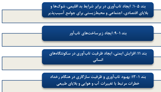
شکل ۴- اهداف تاب‌آوری منشور اتحاد جهان در بحران شهری سازمان ملل

منشور اتحاد جهان در بحران شهری سازمان ملل متحد، با فوریت تاب‌آوری را به عنوان یک هدف اساسی در دستورالعمل شهرهای جدید طبقه‌بندی می‌کند. طبق موارد بیان شده واژه تاب‌آوری شهری به طور صریح در دستورالعمل اقدامات ۲۰۳۰ سازمان ملل برای اهداف توسعه پایدار ۴۴ به رسمیت شناخته شده است. برخی از این اهداف مرتبط به صورت سند چشم‌انداز سال ۲۰۳۰ در شکل ۴ ذکر شده‌اند [۴۷].