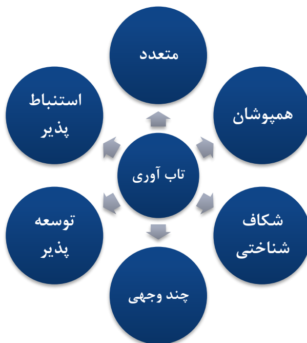
شکل ۳- حالات اصلی فرآیند توسعه شناختی مفهوم تاب‌آوری

به منظور طبقه‌بندی محتوایی تعاریف ارائه شده در ادامه شیوه و سیر شناختی توسعه آن‌ها در شش حالت مطابق شکل ۳ تحلیل شده است. از طرفی این طبقه‌بندی به درک نحوه توسعه تاب‌آوری به عنوان یک مفهوم نوظهور در برابر سیستم‌ها و خطرات نوین کمک خواهد کرد که در ادامه به توضیح هر حالت به همراه مثال پرداخته می‌شود.