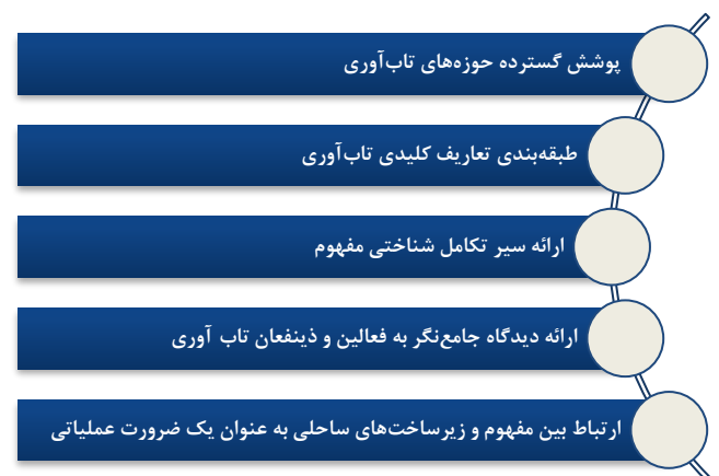
شکل ۱- نوآوری و دست‌آوردهای تعریف‌شناسی تاب‌آوری

روشی کامل و فراگیر برای یک موضوع با در نظر گرفتن عوامل، ابعاد و راه حل‌های پنهان اشاره دارد. به دلیل ماهیت یکپارچه مفهوم تاب‌آوری، رویکرد جامع‌نگر امکان بررسی پیوسته در زمینه‌های مختلف علمی وابسته به محیط شهری را فراهم خواهد کرد. همچنین از دیگر مزیت‌های شناختی استفاده از رویکرد جامع‌نگر در بررسی تحلیلی تاب‌آوری، ارائه فهم مشترک با کمترین پراکندگی محتوایی در ارتباط با سیستم و خطر است. به دلیل گستره شناختی موجود، همکاری بین‌رشته‌ای به پشبرد شناخت این مفهوم کمک خواهد کرد. در مطالعه حاضر با توجه به تاثیر این سطوح عملکردی در زیرساخت‌های ساحلی از تلاش‌های پژوهشی صورت پذیرفته در سایر علوم نیز استفاده خواهد شد. همچنین حوزه‌های شناختی که تاثیر کمتری در درک سیستمی تاب‌آوری دارند مانند روانشناسی مورد بحث و تحلیل قرار نخواهند گرفت. اساساً مفاهیم نوظهور ظرفیت ایجاد خلاقیت شناختی را به همراه دارند. این در صورتی است که توجه به دقت و ظرفیت ارزیابی کمی یک مفهوم، منجر به کاهش ابهام محتوایی خواهد شد [۵]. تعریف‌شناسی تاب‌آوری به فهم مشخص، صریح و درک کامل کمک خواهد کرد و با کاهش ابهام، ظرفیت ایجاد شرایط پیاده‌سازی به عنوان تاب‌آوری در عمل فراهم می‌شود. از دست‌آوردهای مطالعه حاضر می‌توان به شکل ۱ اشاره کرد.