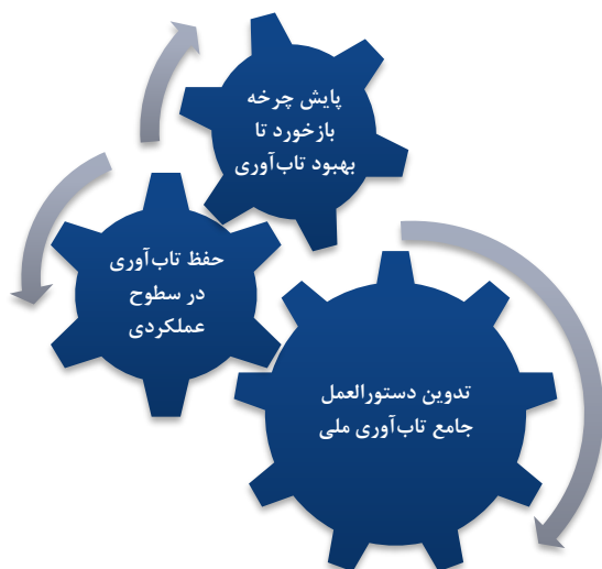
شکل ۵- اقدامات توسعه بر مبنای تاب‌آوری در زیرساخت ساحلی

در این بخش به بیان اقدامات توسعه بر مبنای تاب‌آوری در حوزه زیرساخت‌های ساحلی پرداخته می‌شود. بنادر به عنوان شریان اقتصادی در حکمرانی شناخته می‌شوند. استفاده بی‌وقفه از این شریان حیاتی همزمان با وجود رخدادهای گسترده بیانگر لزوم پیاده‌سازی رویکرد تاب‌آورانه در این مناطق است. این اقدامات به صورت سه گام اساسی در شکل ۵ به صورت خلاصه بیان شده‌اند و در ادامه به تشریح آن‌ها پرداخته شده است.